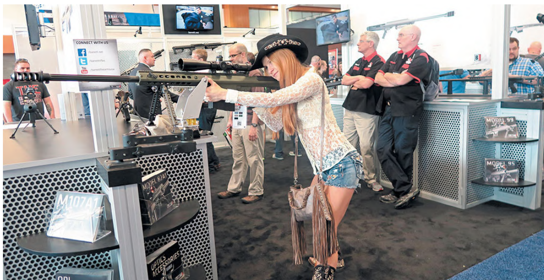
Мария Бутина на оружейной выставке Национальной Стрелковой Ассоциации, г. Нашвилл, Теннесси, 2015 г.