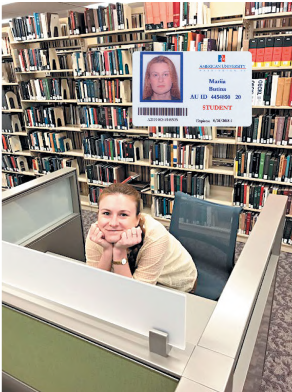
Мария Бутина в библиотеке Американского университета в г. Вашингтон, округ Колумбия, США, май, 2018 г. (за три месяца до ареста)