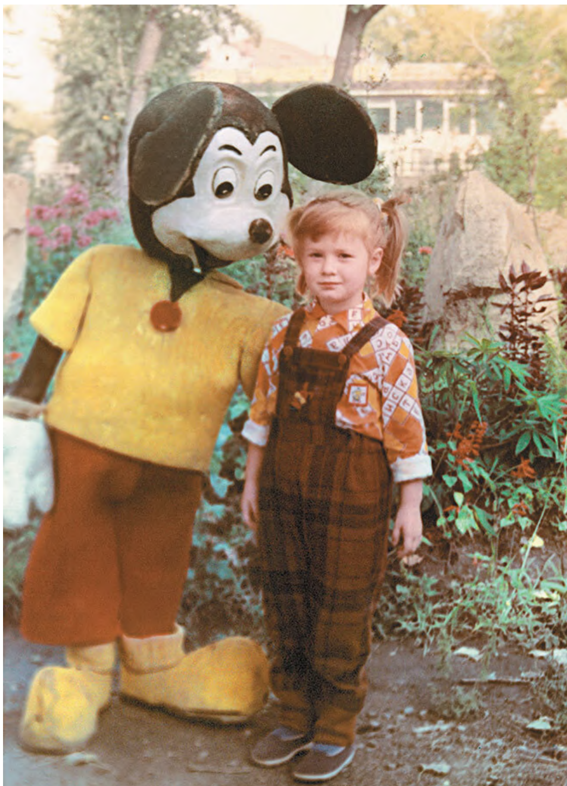
Мария Бутина в селе Кулунда Алтайского края, 1992 г.