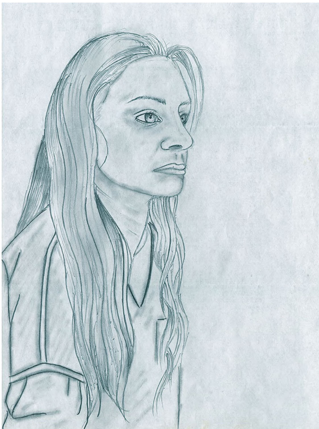
Мария Бутина, тюремный рисунок заключенной, The Grady County Jail («Шейди Грейди»), штат Оклахома, США, май 2018 г.