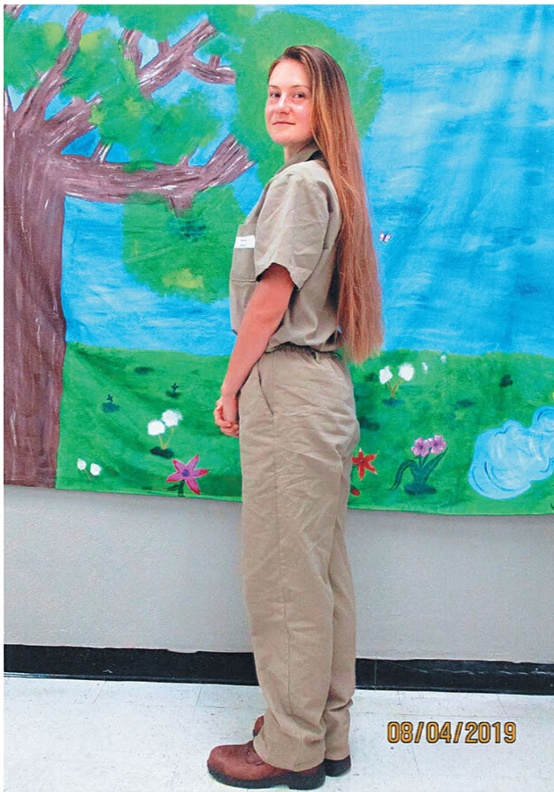
Мария Бутина, федеральная тюрьма штата Флорида, август 2019 г.