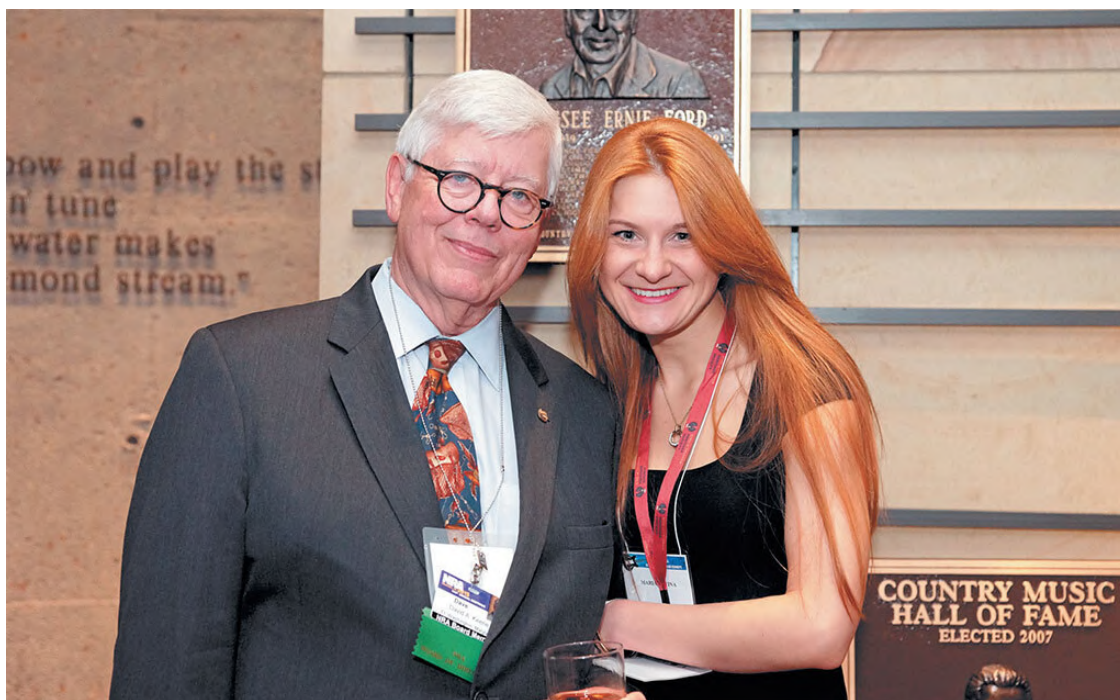
Мария Бутина и экс-президент НСА Дэвид Кин, г. Нашвилл, Теннесси, 2015 г.