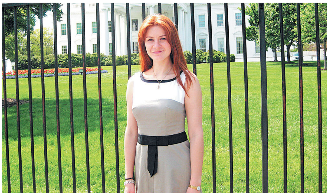
Мария Бутина у Белого Дома, г. Вашингтон, округ Колумбия, лето 2015 г.